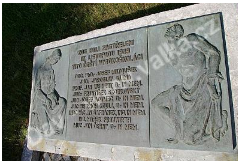
Obrázek 2: Památník v prostoru Dělostřeleckých kasáren v Praze

V noci z 16. na 17. listopadu byl vykonán nekompromisní rozkaz německého vůdce a všech deset českých vysokých škol bylo uzavřeno. Došlo k rozsáhlému zatýkání nejen v Praze, ale i Brně a Příbrami. Devět vedoucích představitelů vysokoškoláků bylo na Ruzyni popraveno a 1200 studentů zbito a odvečeno do koncentračního tábora Sachsenhausen-Oranienburg. Většina z nich byla v letech 1942 a 1943 propuštěna. Útrapy německých koncentračních táborů nepřežilo 35 z nich.