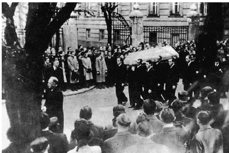
Obrázek 1: Pohřeb Jana Opletala