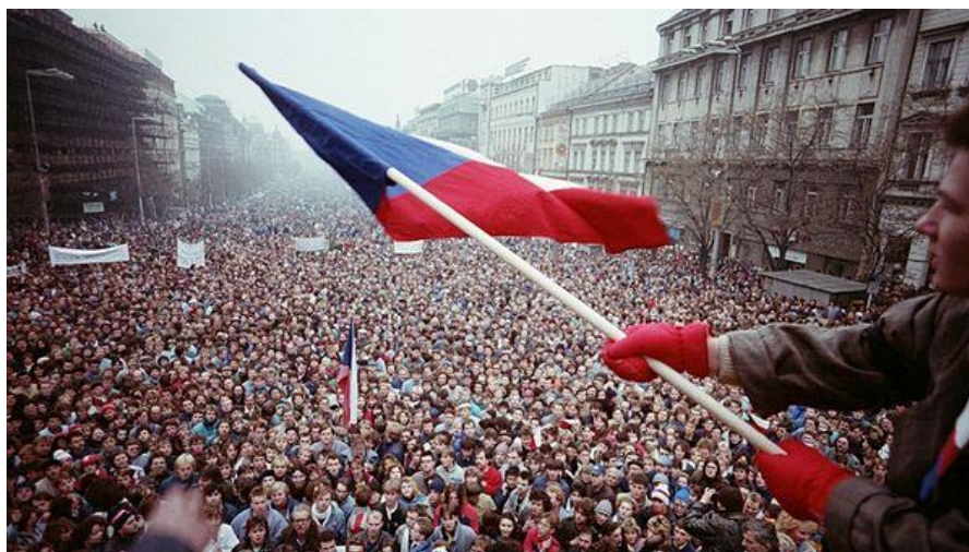
Obrázek 5: Demonstrace na Václavském náměstí