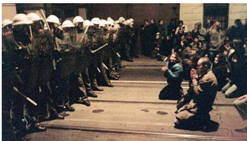
Obrázek 4: Národní třída 1989 – obklíčený dav sedí na zemi

Následně po ukončení demonstrace chtěla většina studentů pokračovat do centra směrem přes Vyšehradskou ulici, Karlovo náměstí na Václavské náměstí. Tomuto průvodu ale zahradili cestu bezpečnostní složky a došlo k prvním incidentům. Rozkaz policie byl jasný, nepustit studenty na Václavské náměstí. Následně došlo k odklonu studentů po nábřeží kolem Národního divadla směr Národní třída a i tento dav byl zastaven a obklíčen a byl znemožněn jakýkoliv únik do okolních ulic. Dle zdrojů bylo uvězněno v mezi kordony dva a tři tisíce lidí. Ti si sedli na zem a skandovali. Policie ještě více stlačila a dav a vyzývala k opuštění prostoru. Jelikož byla oblast hermeticky uzavřená a nebylo možné odejít, po následných rozkazech „považovala“ policie situaci za neuposlechnutí rozkazu a začala účastníky pochodu surově mlátit.