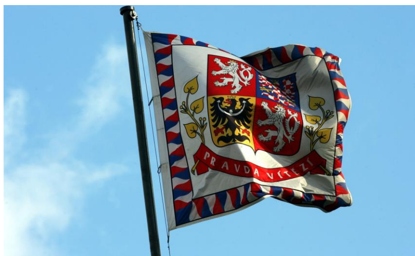
Obrázek 6: Státní znak České Republiky

Nakonec po nátlaku s výhrůžkou další generální stávkou 7. prosince vedoucí komunistická strana rezignovala. O tři dny později rezignoval i stávající prezident Gustav Husák. 29. prosince byl zvolen novým prezidentem Československé republiky Václav Havel. Právě zde se dá již hovořit o prvních dnech novodobého demokratického Československa. [7]